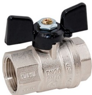
Кран серии 302

Краны шаровые предназначены для простой и быстрой подачи или перекрытия сжатого воздуха, воды и т.д. Выполнены из латуни никелированной, уплотнение шара PTFE. Рабочее давление: до 40 бар (серия 302) и до 16 бар (серия 303). Температура эксплуатации -20...+120°C.